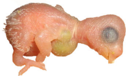
Frisch gefütterter Jungvogel

Der Erfolg einer Handaufzucht hängt von mehreren Faktoren ab. Je jünger die Nestlinge zu Beginn der Handaufzucht sind, desto schlechter stehen normalerweise die Überlebenschancen. Einen Wellensittich ab dem Schlupf großzuziehen, gelingt meist nur sehr erfahrenen Züchtern. Oft fehlt neben der nötigen Fachkenntnis auch die technische Ausrüstung – denn alleiniges Füttern reicht nicht aus, um sehr junge Wellensittiche durchzubringen. Noch unbefiederte Jungvögel brauchen sehr viel Wärme und eine recht hohe Luftfeuchtigkeit, damit sie gesund bleiben und wachsen können.