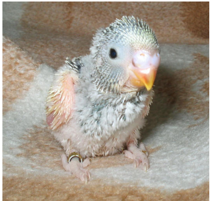
Dieser Wellensittich ist 16 Tage alt

Sehr schwache ältere Vögel, die beispielsweise im Alter von 14 Tagen plötzlich in die Handaufzucht genommen werden müssen und die extrem ausgehungert sind, sollten anfangs mit kleinen Mengen aufgepäppelt werden, bis sich ihre Verdauung wieder an das Futter gewöhnt hat. Nach zwei bis drei Fütterungen kann ihnen meist eine größere Menge Nahrung eingegeben werden, sofern sie kräftig genug sind und ihr Kreislauf nicht zusammenbricht. Hier müssen Sie mit Fingerspitzengefühl vorgehen und lieber etwas vorsichtiger sein, als über das Ziel hinauszuschießen und dadurch die Vögel zu gefährden.