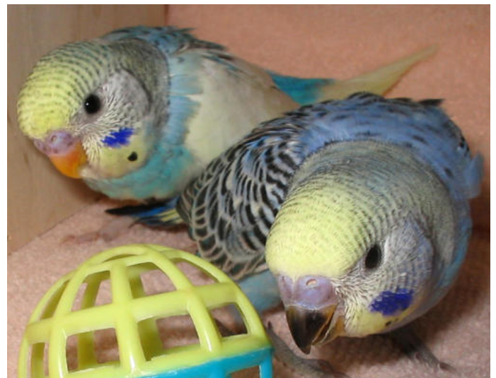
Durch zu frühes und zu intensives Spielen können junge Wellensittiche leicht überfordert werden

Zum Schluss möchte ich Ihnen von ganzem Herzen viel Glück und Kraft für die Handaufzucht Ihrer jungen Wellensittiche wünschen. Sie stellen sich einer schwierigen Aufgabe, die Ihnen hoffentlich viele schöne Momente mit den zarten Lebewesen bescheren wird. Aber ich bin ehrlich: Diese große Aufgabe wird sie auch sehr müde machen und emotional belasten, denn es gibt im Verlaufe nahezu jeder