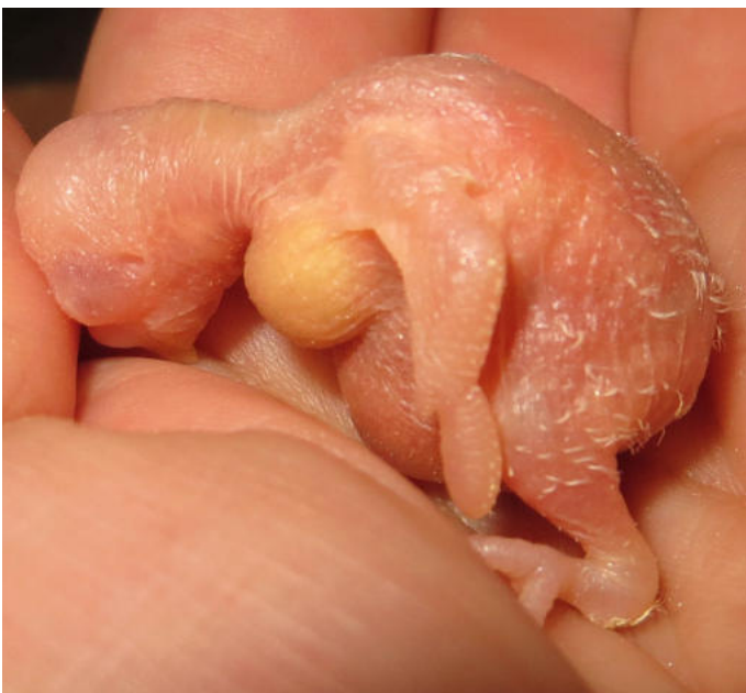
Der Futterbrei ist als helle Masse im Kropf zu sehen

Damit der Vogelkörper diesen enormen Kraftakt bewerkstelligen kann, innerhalb kürzester Zeit Knochen, Muskeln, Gewebe und Federn aufzubauen, ist er auf hochwertige Nahrung in ausreichenden Mengen angewiesen.