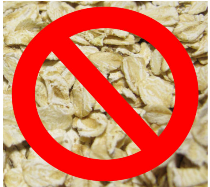
Haferflocken und -brei sind kein geeignetes Handaufzuchtfutter für Wellensittiche

Gehen Sie die Sache deshalb gleich richtig an und kaufen Sie spezielles Handaufzuchtfutter (kein Aufzuchtfutter, das ist etwas anderes!) für Papageien. Dieses Spezialfutter für die Handaufzucht ist ideal auf die Bedürfnisse der heranwachsenden Vögel abgestimmt. Es ist in gut sortierten Zoofachgeschäften erhältlich, auch bei einigen Onlinehändlern, siehe Bezugsquellenangaben am Ende des Leitfadens, kann es bestellt werden.