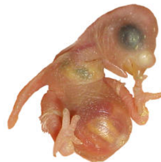
Die Augen dieses sehr jungen Wellensittichs sind noch geschlossen

Die Augen frisch geschlüpfter Wellensittiche sind geschlossen, die Tiere sind nackt und extrem empfindlich. Ihr Körper ist darauf angewiesen, ständig gewärmt zu werden, was normalerweise die Mutter übernimmt. Außerdem darf die Umgebung nicht zu trocken sein. Die relative Luftfeuchte im Nistkasten oder Nestbereich sollte bei circa 60 % liegen, also vergleichsweise hoch.